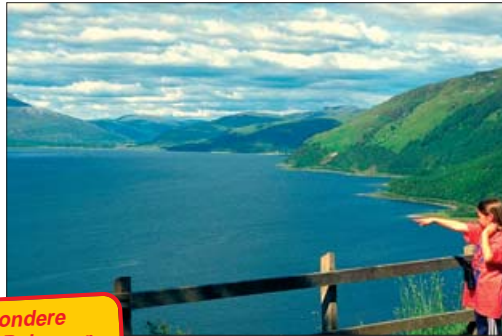
Die besondere Hochland-Reise zur Rhododendren-Blüte